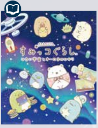
©2024 San-X Co., Ltd. All Rights Reserved.