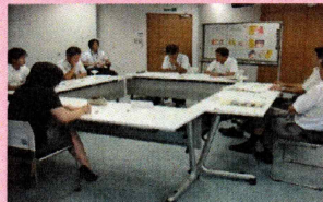
教員研修 模擬裁判の様子