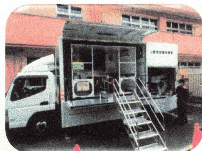
じしんたいけん 地震体験