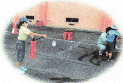
しょうかたいけん 消火体験