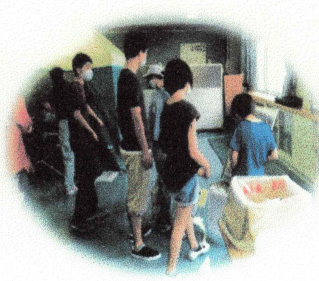
しきざいたいけん 資機材体験