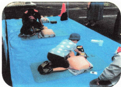
おうきゅうてあてたいけん 応急手当体験