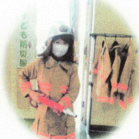
ようねんぼうかい しちやくたいけん 幼年防火衣の試着体験